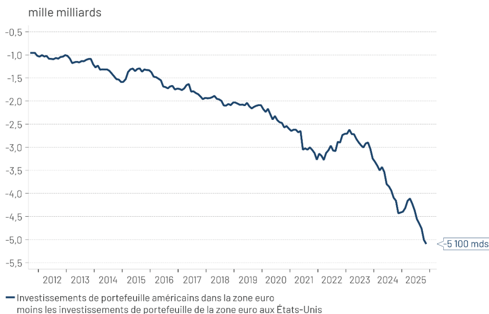
Graphique 1 : Position extérieure nette des États-Unis versus la zone euro (investissements de portefeuille)